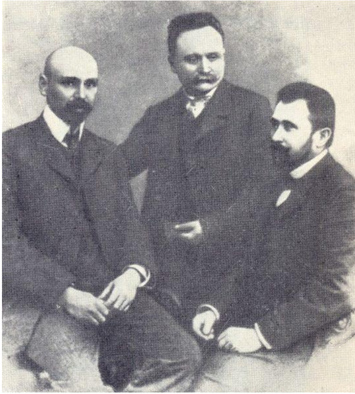
М. Коцюбинський, І. Франко та В. Гнатюк. Львів, 1905 р.

Молодий випускник Львівського університету Володимир Гнатюк, учень М. Грушевського, наприкінці 1898 року стає секретарем НТШ. Цю посаду з невеликими перервами через хворобу він обіймав аж до смерті в 1926 році, віддано працював та був душею цієї установи. Основним зацікавленням В. Гнатюка, визначеним, як бачимо, ще з дитинства, була фольклористика, яку тоді називали «етнографія». На цьому поприщі він реалізував себе насамперед як надзвичайно працюючий збирач і також як видавець фольклорних матеріалів. Окрім Галичини, він досліджував Закарпаття й українські поселення в Сербії. Коли туберкульоз завадив йому особисто їздити в експедиції, Гнатюк почав записувати фольклор за допомогою широкої мережі кореспондентів з різних регіонів України.