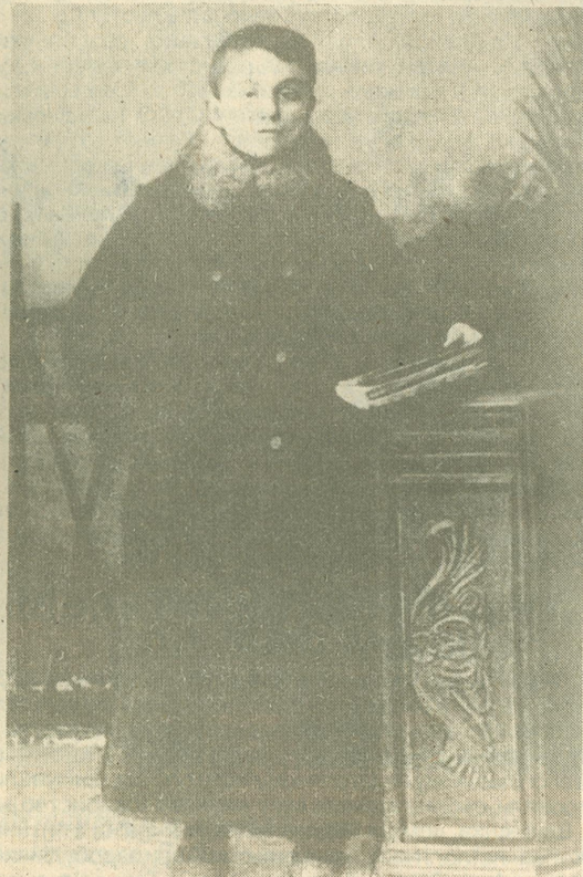
Володимир ГНАТЮК у дитячі роки.