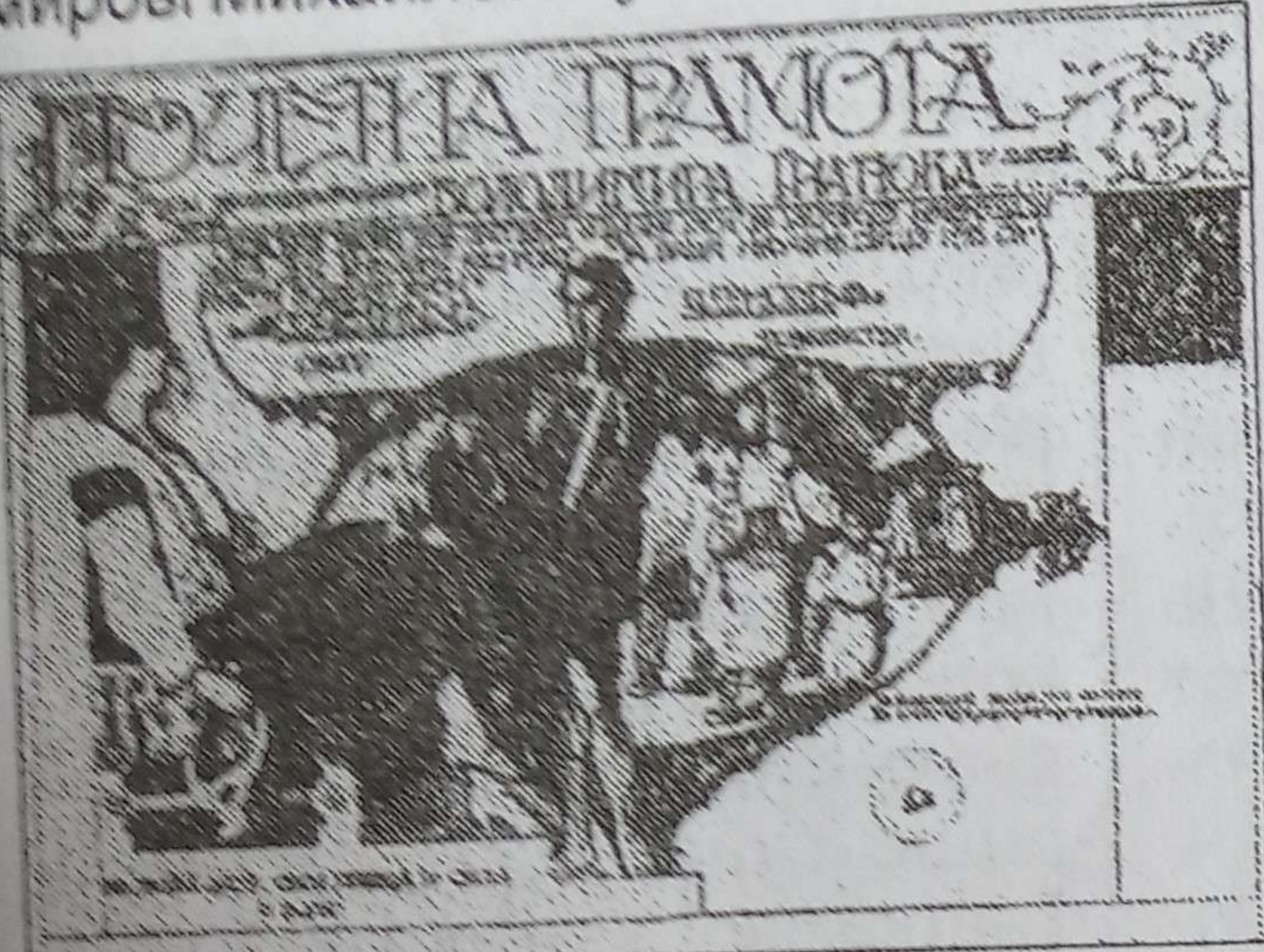
Грамота про обрання В.Гнатюка почесним членом «Просвіти» в Ужгороді (1921).

матеріального виробництва, ремесла і промисли, одяг і культура та інше.